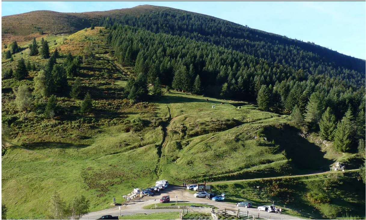
Le col de Port dominé par le Pic d'Estibat