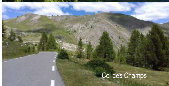
Col des Champs