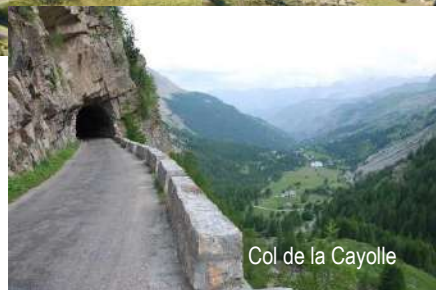
Col de la Cayolle