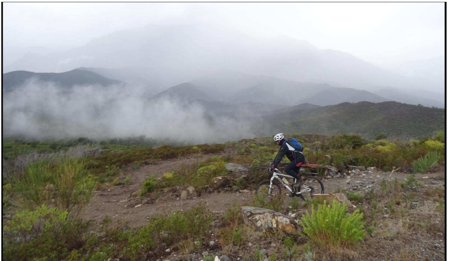
Reconnaissance automnale du côté d'Erbaolo