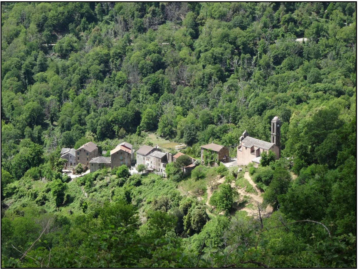
Villages de la Castagniccia