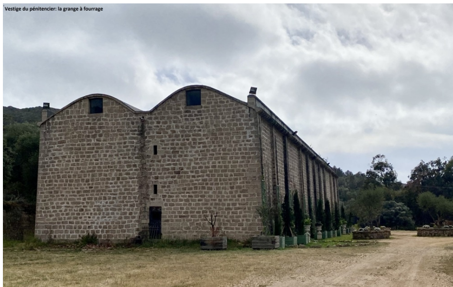
Vestige du pénitencier, la grange à fourrage

Bocca di Strettone (FR-2A-0365) n'est plus accessible ou alors douloureusement !