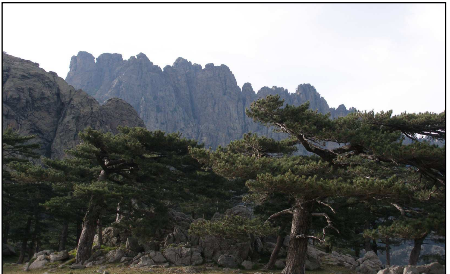
Pins laricii tourmentés de la forêt de Bavella et Massif de Paliri