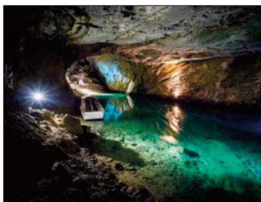
Le lac souterrain de Saint-Léonard.

Pour les réparations de votre vélo: DOM CYCLES, chemin du Sillon 2, 1860 Aigle, tél. +41 24 466 93 88.