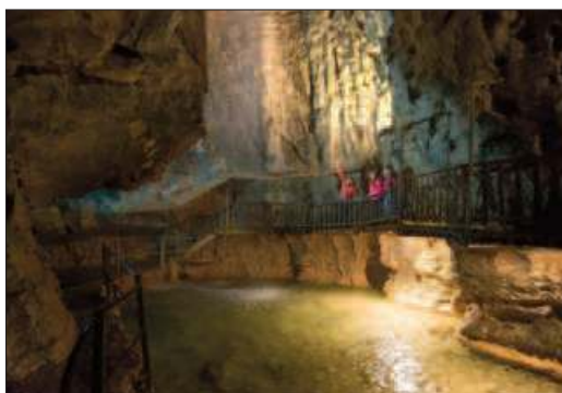
Le lac souterrain de la Grotte aux fées.

la promenade souterraine atteint son paroxysme lorsque le visiteur aperçoit un petit lac alimenté par une vertigineuse cascade.